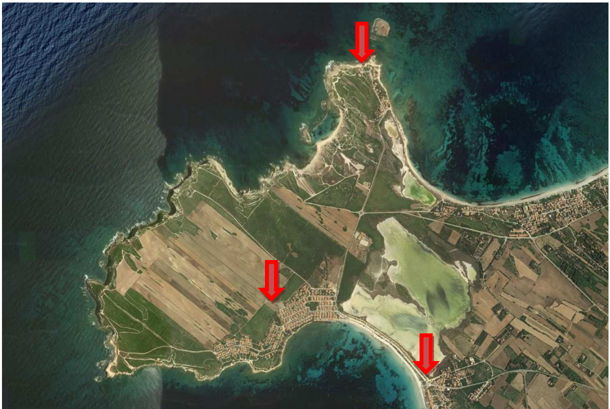
VISTA AEREA BORGATE MARINE

AREE OGGETTO DEL PRESENTE LAVORO (Inquadramento satellitare)