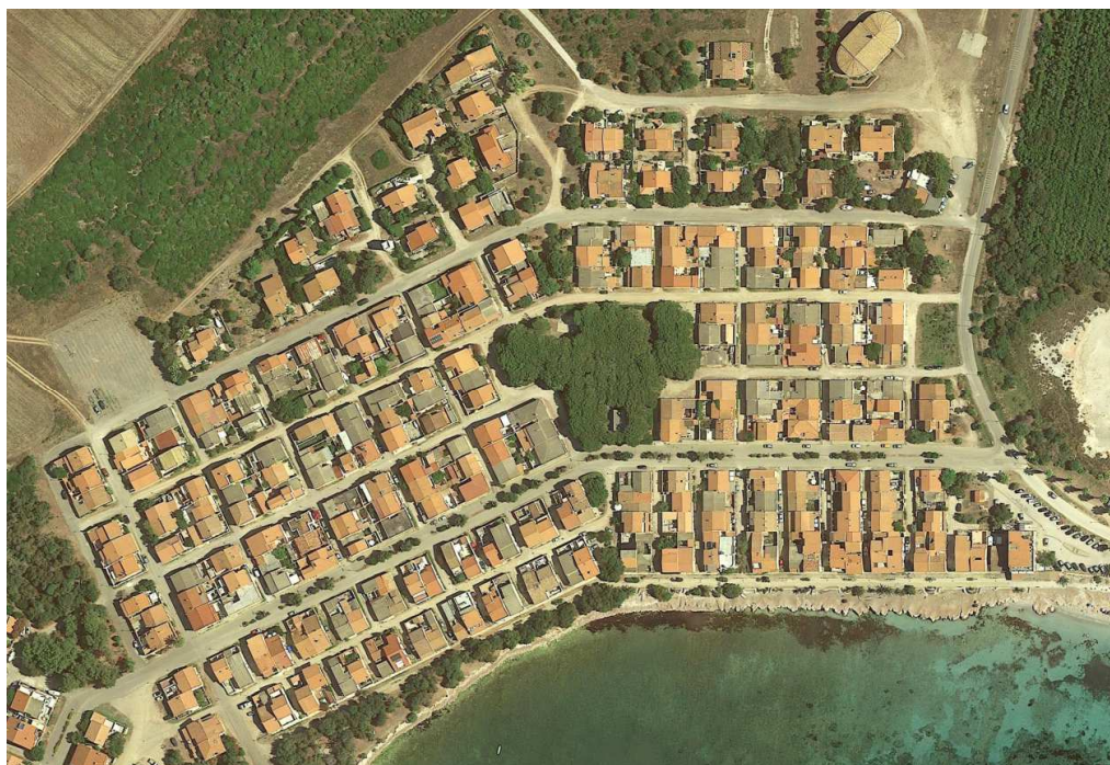
Aree urbanizzate non più utilizzabili per i fini della Legge n. 1766/27