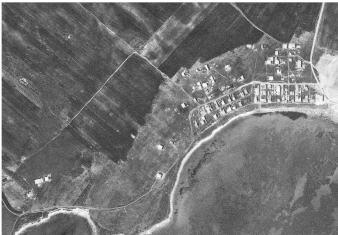
IMMAGINE SATELLITARE 1968

FOGLI C.T. 23/24 - VEDUTA AEREA MANDRIOLA 1