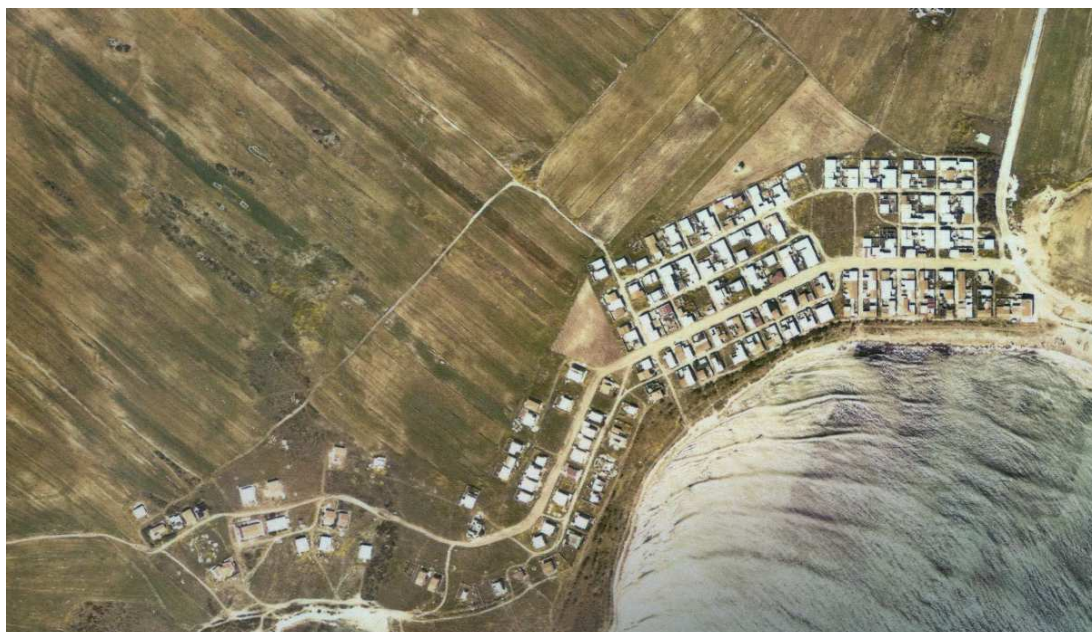
IMMAGINE SATELLITARE 1977-1978 MANDRIOLA (GEOPORTALE RAS)

FOGLI C.T. 23/24 - VEDUTA AEREA MANDRIOLA 1