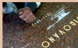
INCISIONI A MANO LIBERA