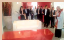
SALA DEL COMMiato

Bellagio (Co) Via T. Tasso, 7 tel 031 951835