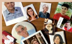
REALIZZAZIONE FOTOCERAMICHE E RICORDINI