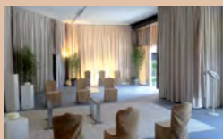
REALIZZAZIONE CAMERE ARDENTI