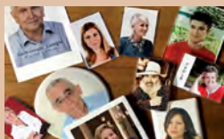
REALIZZAZIONE FOTOCERAMICHE E RICORDINI