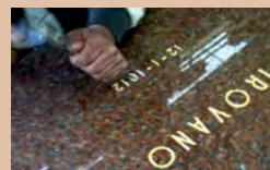
INCISIONI A MANO LIBERA