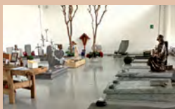
ESPOSIZIONE MONUMENTI AL COPERTO