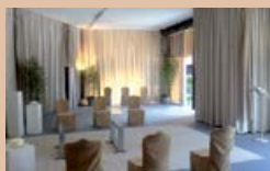
REALIZZAZIONE CAMERE ARDENTI