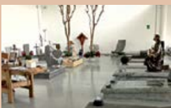
ESPOSIZIONE MONUMENTI AL COPERTO