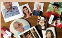
REALIZZAZIONE FOTOCERAMICHE E RICORDINI