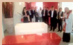
SALA DEL COMMiato

Bellagio (Co) Via T. Tasso, 7 tel 031 951835