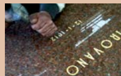
INCISIONI A MANO LIBERA