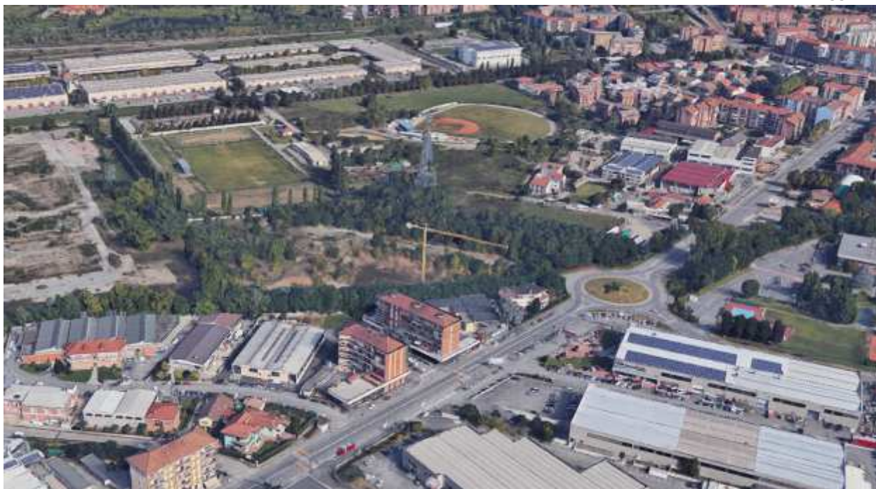
FOTO 7 Ripresa da sud