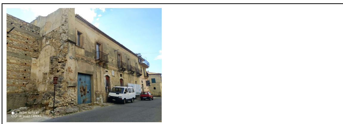
Fotografia del fronte e del contesto -CONVENTO DOMENICANI - scorcio da VIA SANTA CATERINA