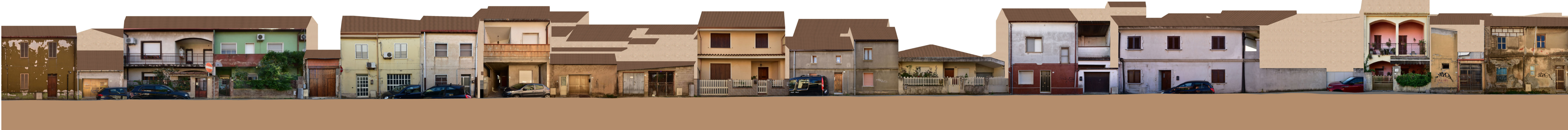
PROFILO C _ C Via Cesare Battisti