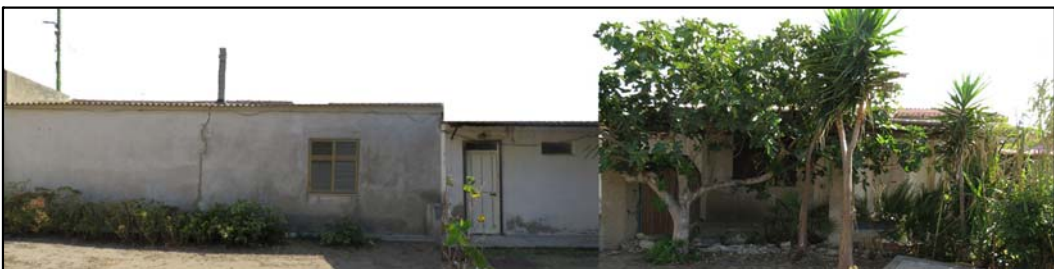
PROFILO B _ B Piazza