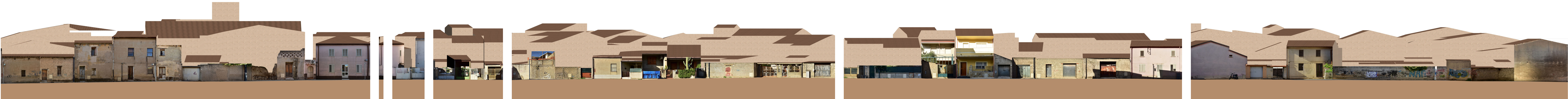
PROFILO B _ B Via Michelangelo Buonarroti