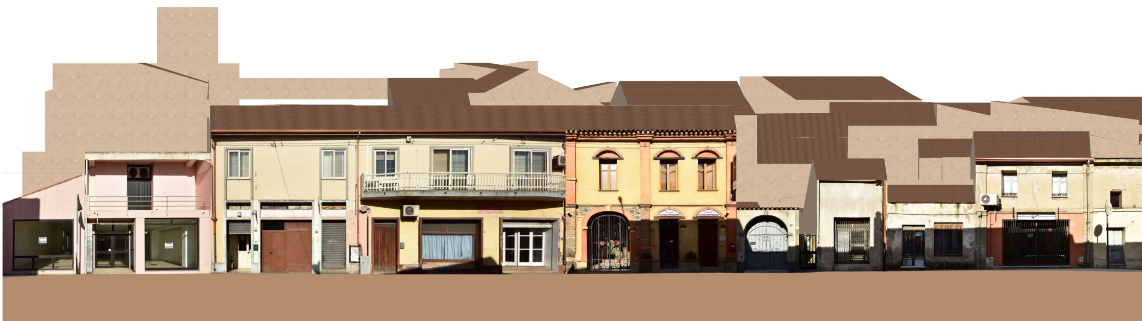
PROFILO A _ A Via Roma