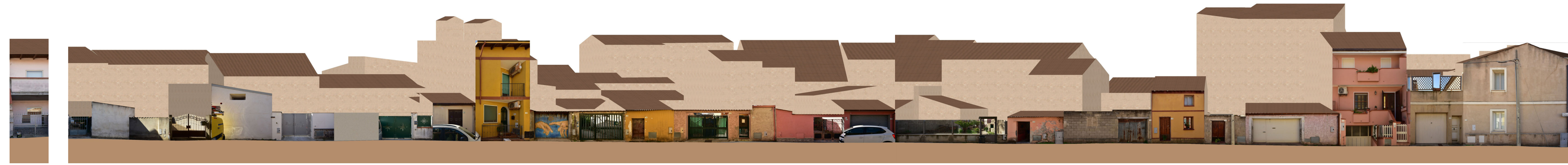
PROFILO B _ B Viottolo Funtaneda