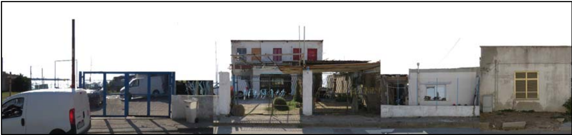
PROFILO A _ A Via della Pineta