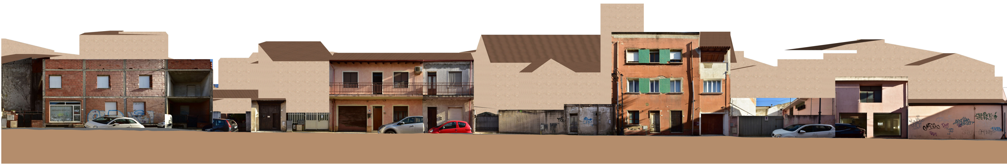
PROFILO D _ D Via Cavour