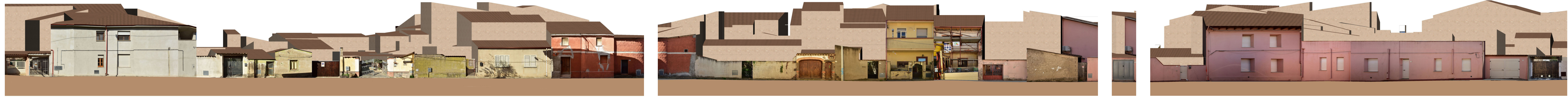
PROFILO A _ A Viottolo Tola