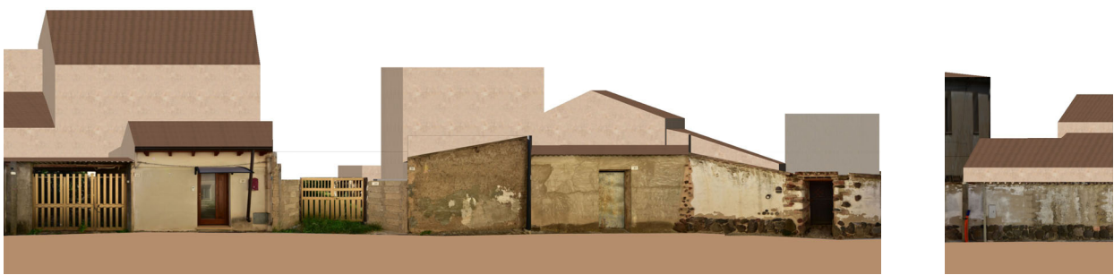
PROFILO A _ A Viottolo Tola PROFILO B _ B Viottolo Tola