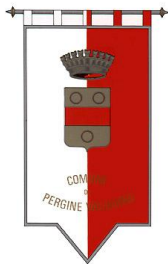
Comune di Pergine Valdarno