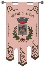
Comune di Bucine