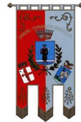
Comune di Terranuova Bracciolini