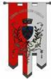
Comune di Castiglion Fibocchi