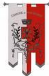
Comune di Pian di Scò