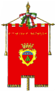
Comune di Montevarchi