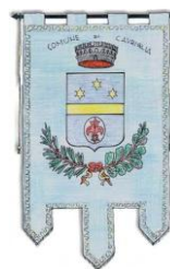
Comune di Cavriglia