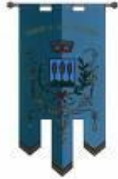
Comune di Loro Ciuffenna