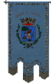
Comune di Laterina